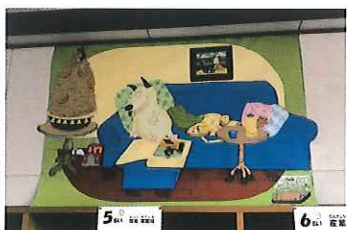
（作品名：パムとケロのにちようび）