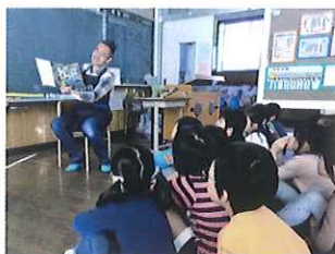
▲男性のボランティアも活躍中