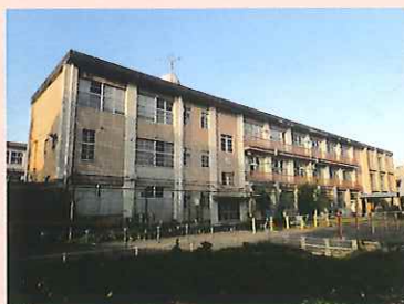
【現在の南校舎の様子】

工事完了までの期間、校内での児童の移動経路及び来校時の経路等も変更となり、ご不便・ご迷惑をおかけ致しますが、ご理解、ご協力賜り、南校舎が強く・たくましく生まれ変わっていく姿を見守っていただけたらと思います。