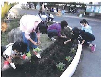
▲今年度は花園委員とコラボして植付を実施しました。

毎年たくさんの綺麗な花を提供して下さるフラワーボランティアの皆様。年間計画を立て、江尻小の花壇を、花いっぱいにしていただいています。花園委員会と協力し、子どもたちに花の植え方・育て方を指導していただきました。