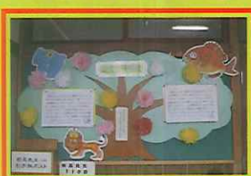
校長先生こだわりのコーナー

二つめは、メッセージを発信することです。子供たちの嬉しい姿を見つけたら、それを伝える簡単な文書を書いて「江尻っ子模様」という校長室の前にあるコーナーに貼り出します。1年間でだいたい50号くらいのゆっくりとしたペースですが、子どもたちはけっこう関心を持って見てくれます。