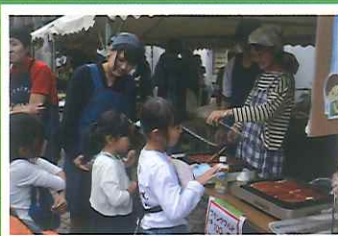
▲いろいろ買っちゃう♪