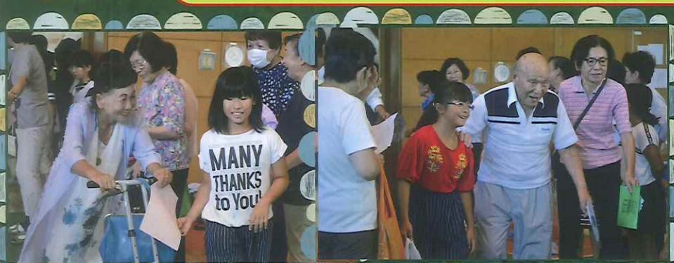
▲ 江尻地区敬老会(4年生)