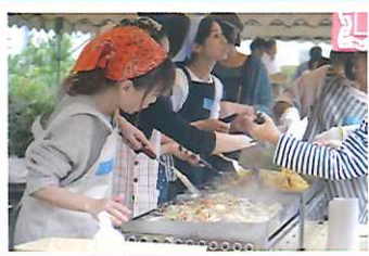
▲焼きそばも美味しかった!