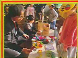
なんのコーナーかな?