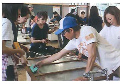
▲飛散防止フィルムを貼ります