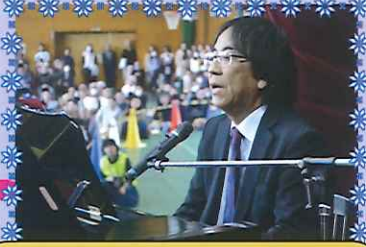
みんなのお手本、校長先生!