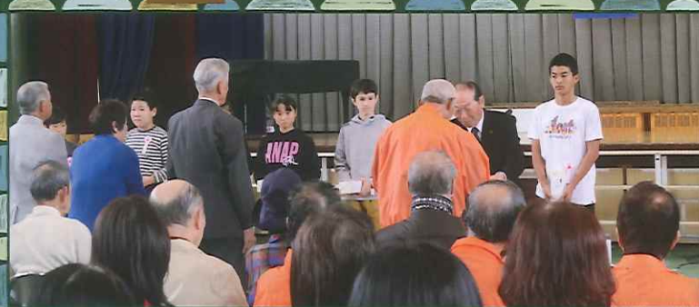
▶ 青少年育成大会(6年生)