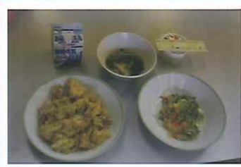
▲人気の「キムタクごはん」登場!