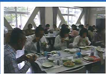
▲美味しい給食にみんな大満足でした♪