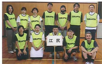
▲頼もしい仲間たち!