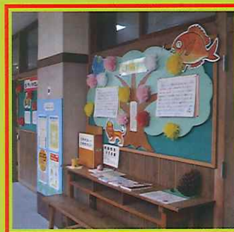
賑やかな校長室前

二つめは、メッセージを発信することです。子供たちの嬉しい姿を見つけたら、それを伝える簡単な文書を書いて「江尻っ子模様」という校長室の前にあるコーナーに貼り出します。1年間でだいたい50号くらいのゆっくりとしたペースですが、子どもたちはけっこう関心を持って見てくれます。