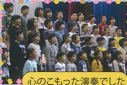
心のこもった演奏でした