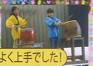
テンポもよく上手でした!