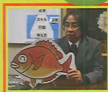
まだまだあります!

最近では、「冬休みに大事な、あいうえお」という話や、「2匹の力エル…ふりかえる&むかえる」という話をしました。まだ覚えててくれるといいのですが。