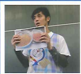
▲先生のアイデアに脱帽!