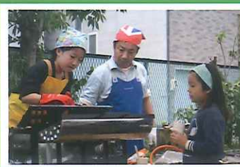
▲ベビーカステラ職人!