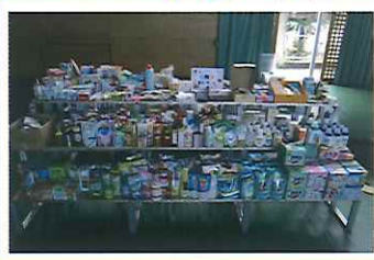
▲たくさんの商品を、前日に見やすく並べました。