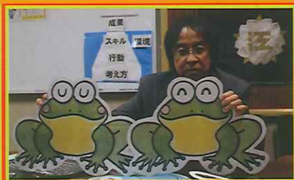
全部手作り! 力作ばかり

一つめは、全校集会などでも子供たちの前で話す時は「覚えやすい話をする」ということです。子どもたちに話したいことは、いつでも心がけたり考えたりしてほしいことばかり。覚えにくかったりすぐに忘れられたりしないように、シンプルで分かりやすく、また自作のフリックボードを使ったりします。