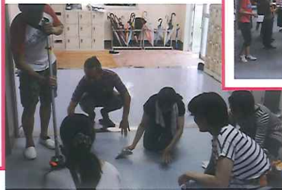
▲床も窓もピカピカ!