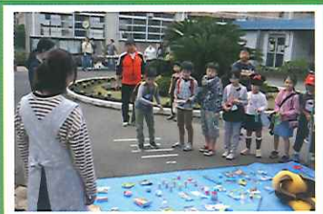
▲人気のゲームコーナー