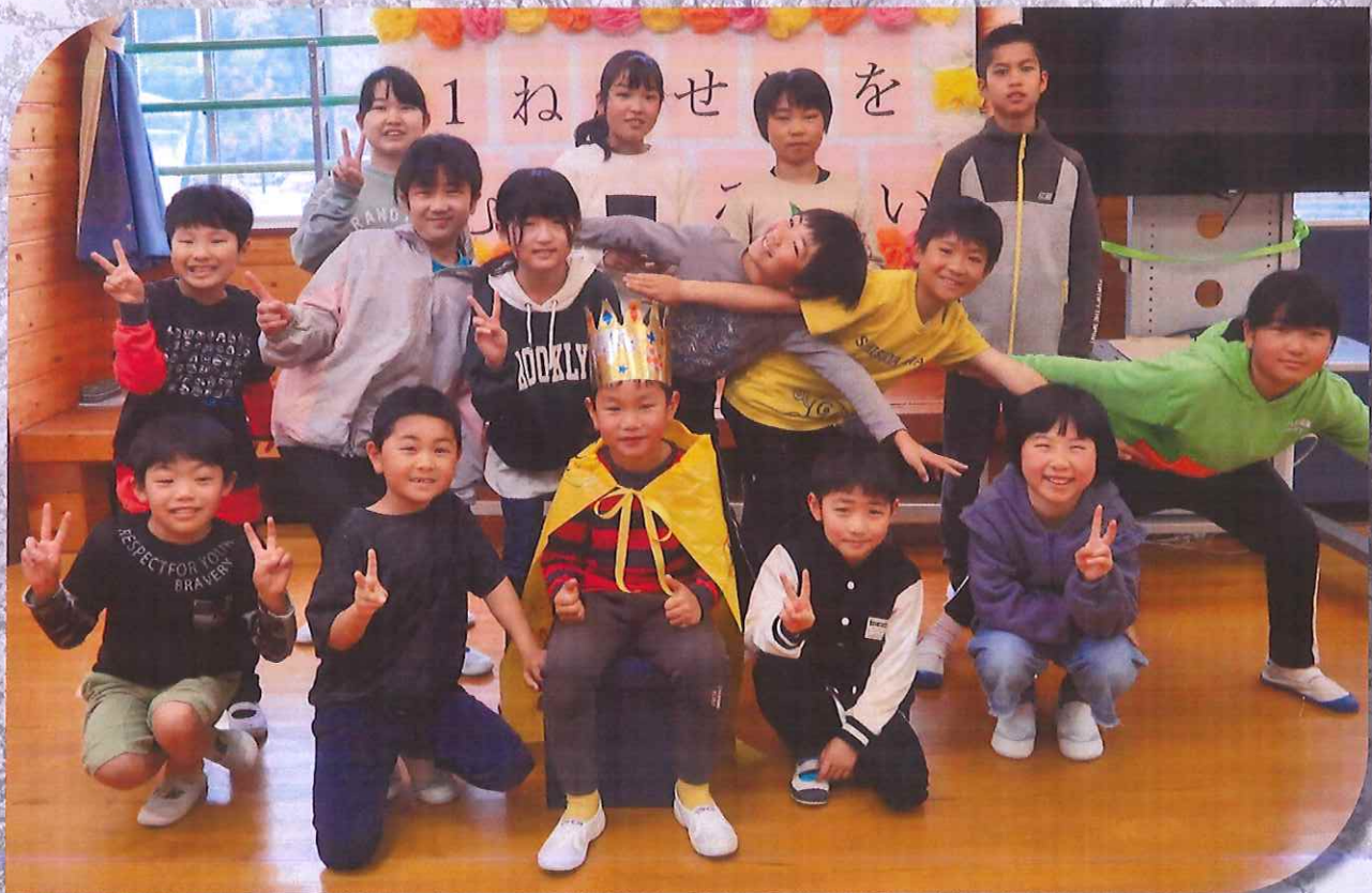
児童数: 15名 職員数: 13名 (令和4年4月現在)