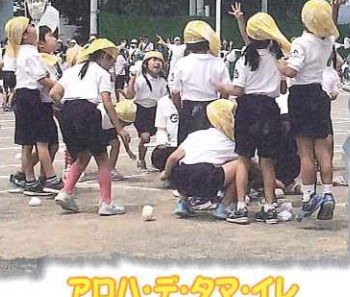
アロハ・デ・タマ・イレ