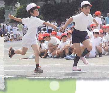
パワーをつないで