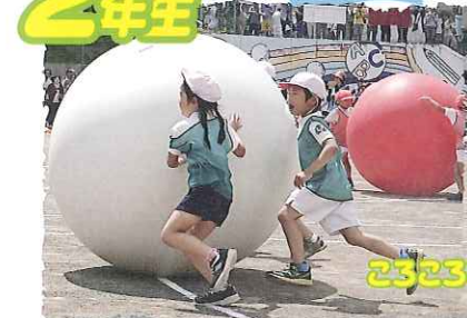
ころころ取めようwinnerへジャンプ