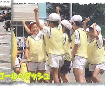
山こえ穴こえゴールへダッシュ