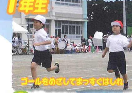
ゴールをめざしてまっすぐはしれ