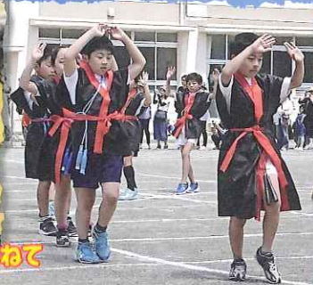
止まらない笑顔で踊って跳ねて