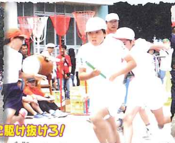
一致団結!絆を胸に駆け抜けろ!