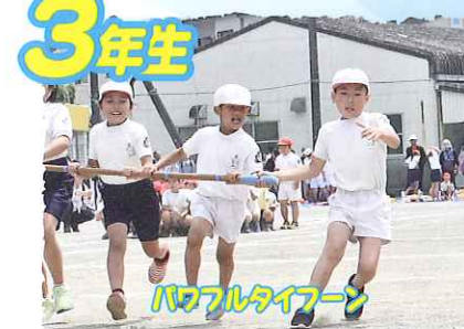
パワフルタイアーン