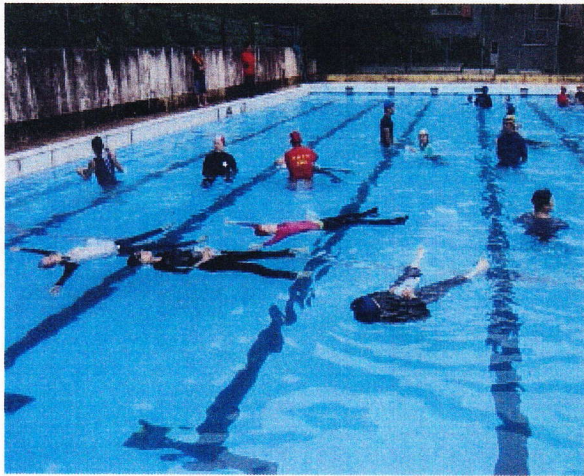
力を抜いて大の字になってます ペットボトルを抱えています