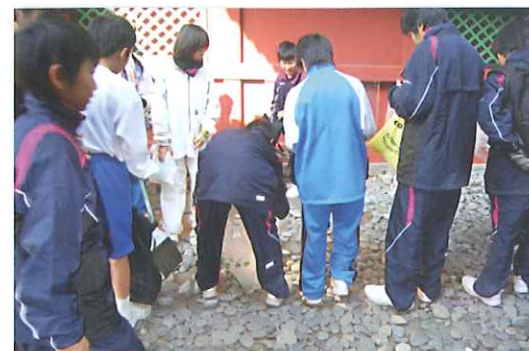
観光客がご利益があると思って、石を持ち帰ってしまうので、石を補充