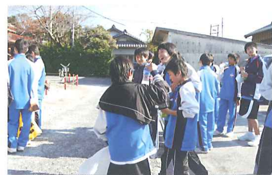
働いた後のご褒美ジュースは最高