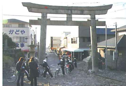
自転車や送迎などで現地へ集合 中にはランニングで駆けつける生徒も