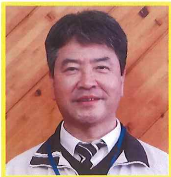
「子どもが主役の学校」づくり