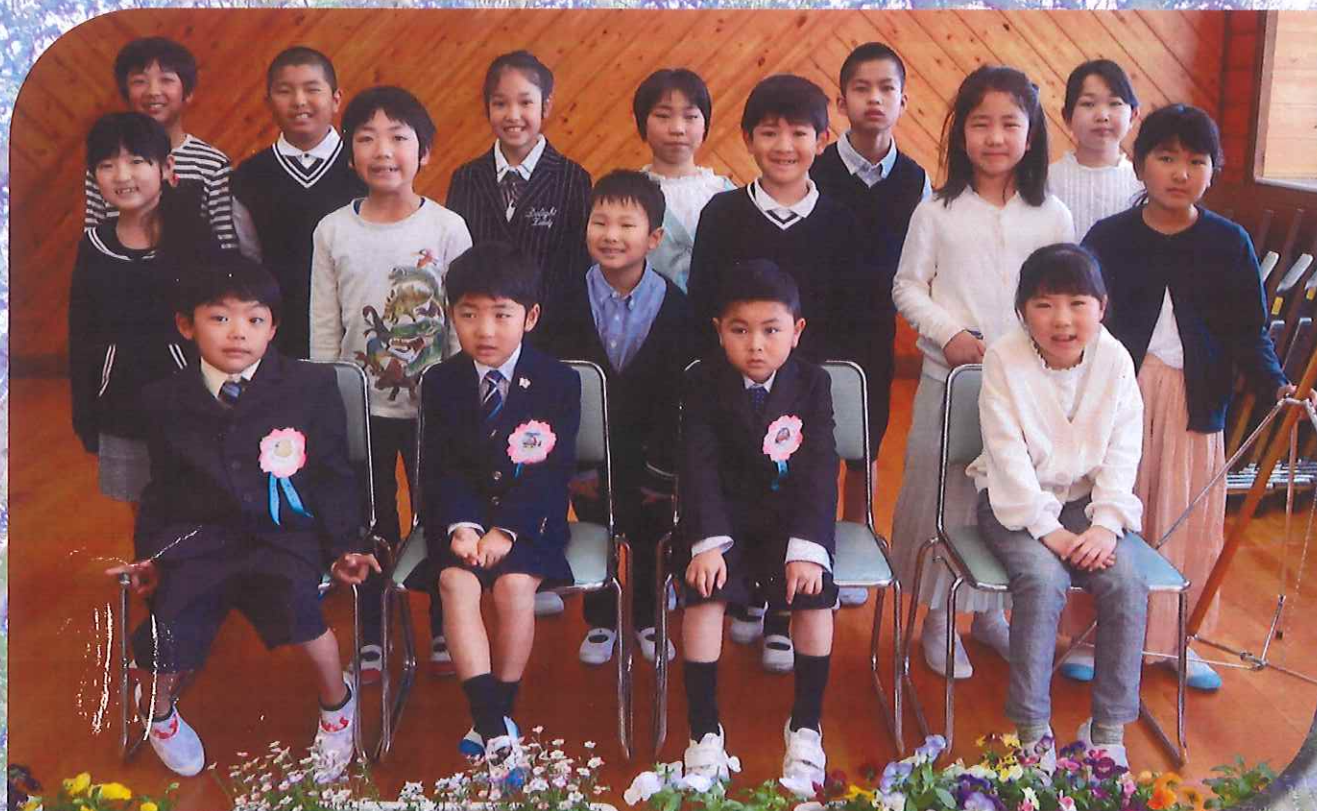
児童数: 16名 職員数: 13名 (令和3年4月現在)