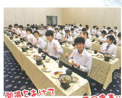
開演をあげて 同じ方向を向いての食事...