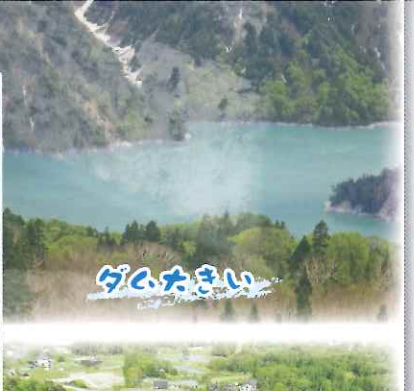
2日目 立山黒部アルペンルート、黒部ダム見学(富山県)、白馬オリンピック「ジャンプ台」見学(長野県)