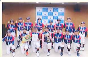
番町小の4名が 選抜チームへ加入