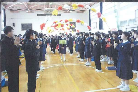
対面式 2,3年生がつくる花道を、新入生が入場