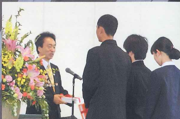
始業式 校長先生から教科書を授与される各学年の代表生徒