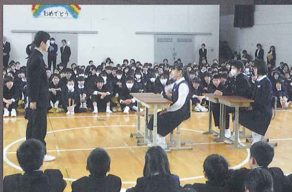
対面式 中学校生活を、わかりやすく劇で説明