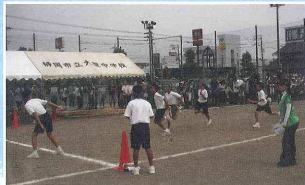
2年学級対抗リレー