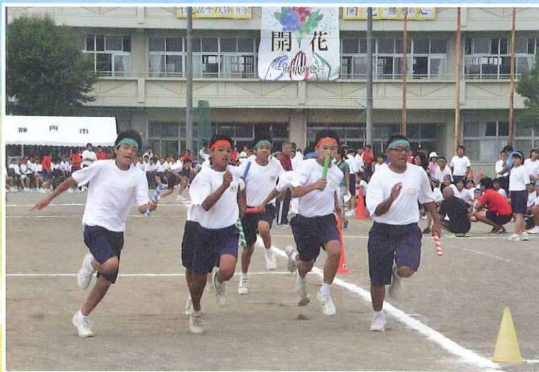
1年学級対抗リレー

今回の体育祭では青組団長をやって、リーダーの大変さとやりがいを学びました。うまく練習を進行できないことが何回もありましたが、仲間に何度も助けてもらいました。良い仲間と共に応援ができ、僕にとって最高の体育祭になりました。