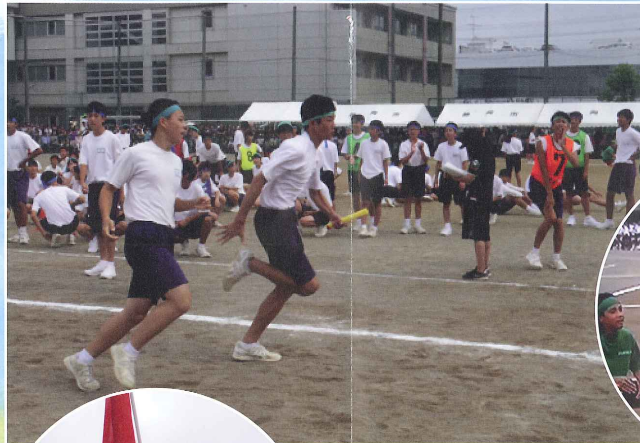
3年学級対抗リレー