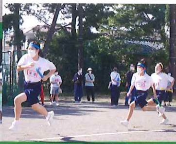
1 年 生 リ レ ー

私は、最後の体育祭はとても楽しかったです。初めての団長でみんなを引っ張れるか心配でした。ですが、応援の呼びかけをしたら、しっかり聞いてくれて嬉しかったです。