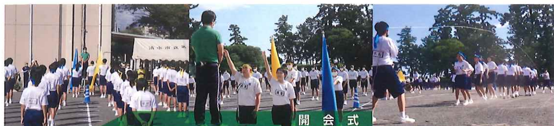
開 会 式