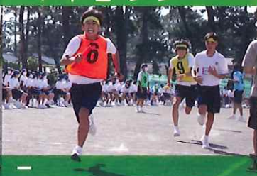
2 年 生 リ レ ー