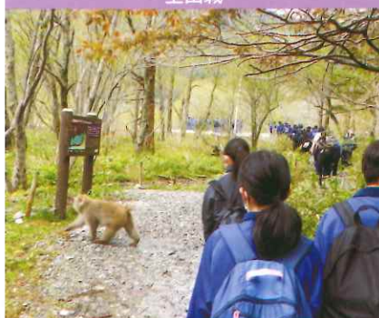
上高地トレッキング