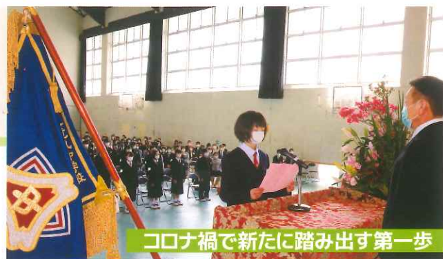
コロナ禍で新たに踏み出す第一歩

4月7日、139名の新入生が竜爪中の仲間入りをしました。新しい中学校生活のスタートにふさわしい立派な入学式でした。1年生では、中学校3年間の土台(基礎)を築いていきたいと考えています。お城を支える石垣の石のように、個性の違う一人ひとりが力を出し合い、簡単には崩れない集団を目指していきます。