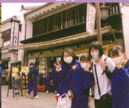
善光寺仲見世通り