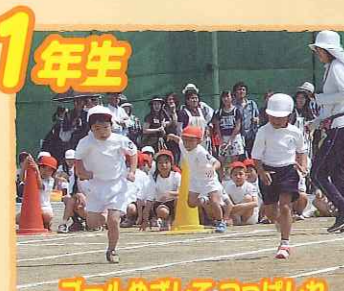
ゴールめざしてつぼしれ