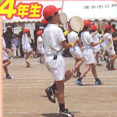
One For All All For One! 気持ちを合わせてイヤーサッサ!