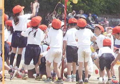
アルゴリズムたまれ