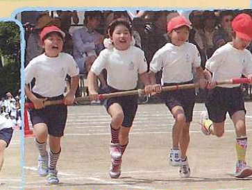
挑戦!!みんなてつくる台風目