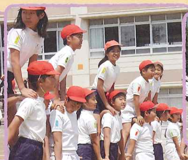
有度山の戦い(騎馬戦)