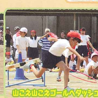
山こえ山こえゴールへダッシュ