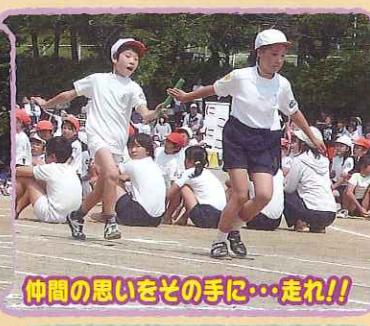
仲間の思いをその手に...走れ!!