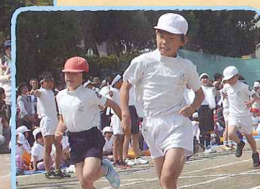
元気玉もあつめてダッシュだ!