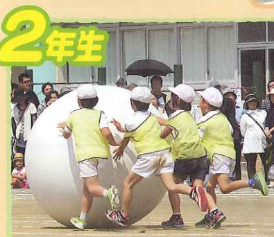
はりきり大玉ころころキリリ