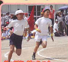
がんばれダッシュ!