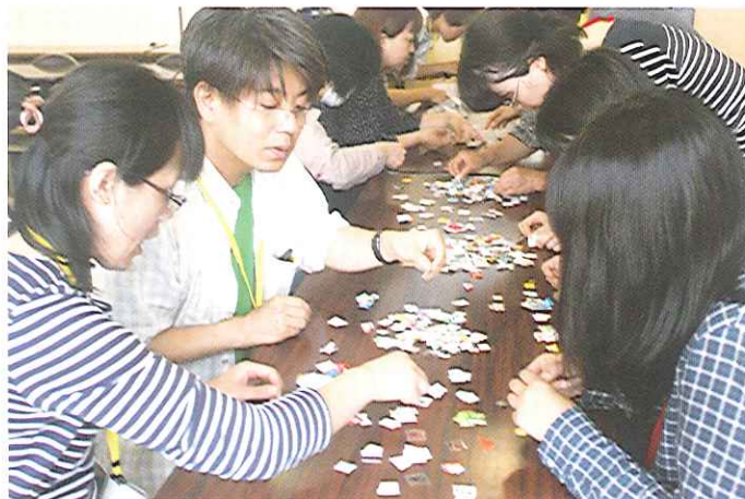
保健委員のみなさん、仕分け作業ありがとうございます！