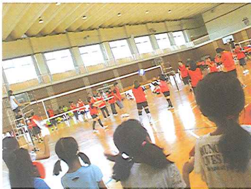
チームワーク抜群