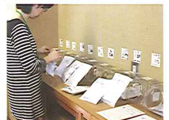
種類ごとの袋詰め