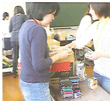
インクカートリッジ仕分け