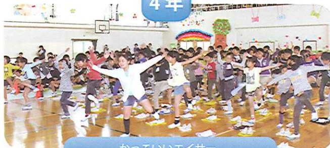
かっこいいエイサー