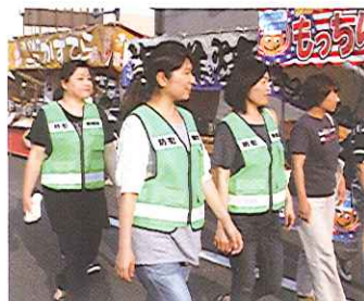
2グループに分かれ パトロール出発。