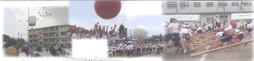
PTA 玉入れ 71対71 奇跡の引き分けに 大盛り上がり!!