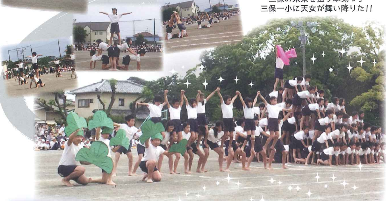
5・6年 和 ～三保の未来を担う本気っ子～ 三保一小に天女が舞い降りた!!