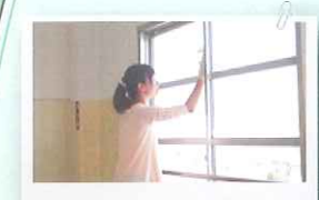
6月14日(土) 環境整備委員会 校内整備作業