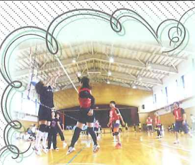
6月8日(日) 保健体育委員会 市P連第107回親睦 バレーボール大会