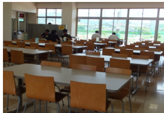
★ 静学ホール(学食) ★