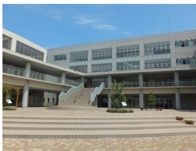
～素敵な校舎と中庭～

※教育ビジョンだけでなく、子育てについても楽しくお話ししていただきました。 ありがとうございました。