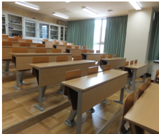
★大学みたい?! 物理実験室★