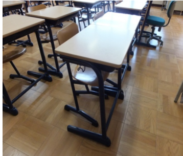
★座りやすさを考えた おしゃれなデザインの机といす★