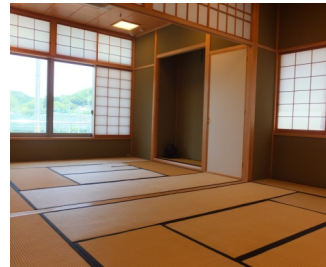
★ ~お茶室~ ★