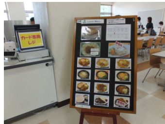
どれもとっても おいしそう!

最後になりましたが、校長先生はじめ諸先生方、お忙しい中本当にありがとうございました。 とても素敵な時間を過ごすことができました。